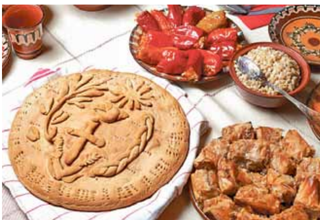
Игнажден слага началото на коледните празници

В миналото към трапезата се прилагат строги изисквания, голяма част от тях се спазват и днес. Броят на ястията трябва да бъде нечетен, но основната идея