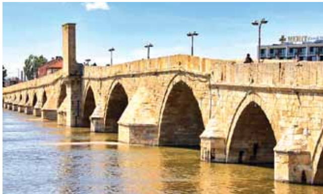
Свиленградският каменен мост е построен по нареждане на Дамад Мустафа паша през времето на султан Сюлейман Великолепни (1520-1566).

Легендата разказва, че мостът над буйната някога Марица бил издигнат за себап на християните от един турски везир. (Според