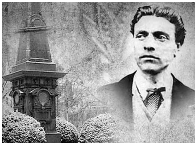
„Цели сме изгорели от парене и пак не знаем да духаме...“

Например напоследък четох статиите за мемориала в Карлово и доста се възмутих в общия хор! Толкова ли не можем да измислим и изградим паметник, достоен за