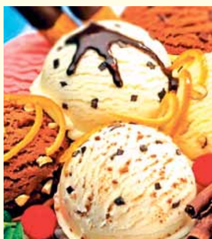
Празникът на най-вкусното лятно изкушение се отбелязва всяка трета неделя на юли.