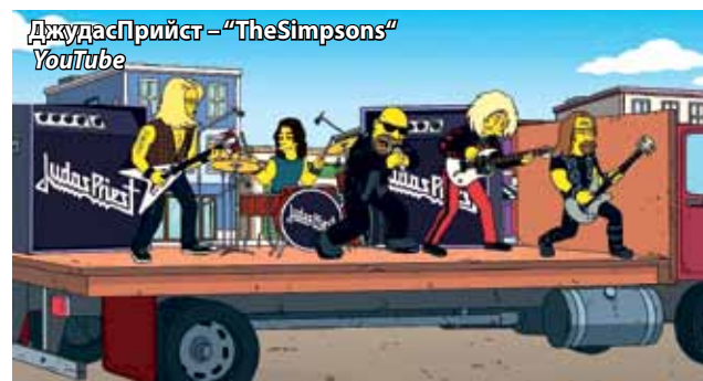
Джудас Прийтс – "The Simpsons" YouTube