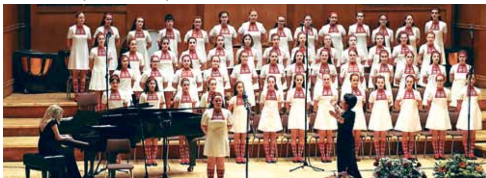
60-годишнината на Детския радиохор дойде и с подаръци за верните почитатели на талантливите деца - цели три компактдиска, единият от които е юбилеен и в него могат да бъдат открити паметни изпълнения. Другите два диска са издадени с благотворителна цел.

Държавният глава дава тази награда в знак на уважение към таланта на поколения български деца, които са прославили България с пеенето си.