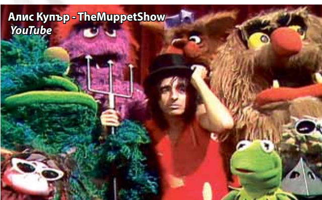
Алис Купър - The Muppet Show YouTube

неуспешна телепортация в Космоса, а специалният "гост от ада" Алис Купър, този път в ролята на агент на Дявола, предлага "страхотни богатства и световна слава" на Мъпетите в замаяна на душите им. И поблажен от идеята за световна слава, Gonzo едва не подписва договор, но липсата на пи-