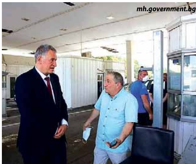
Здравният министър на България доктор Стойчо Кацаров обявява новата система за влизане в страната

Зелена зона – в нея попадат пристигащите от Австрия, Германия, Естония, Исландия, Литва, Люксембург, Малта, Полша, Словакия, Унгария, Финландия, Хърватска, Гърция, Дания, Италия, Словения, Фран-