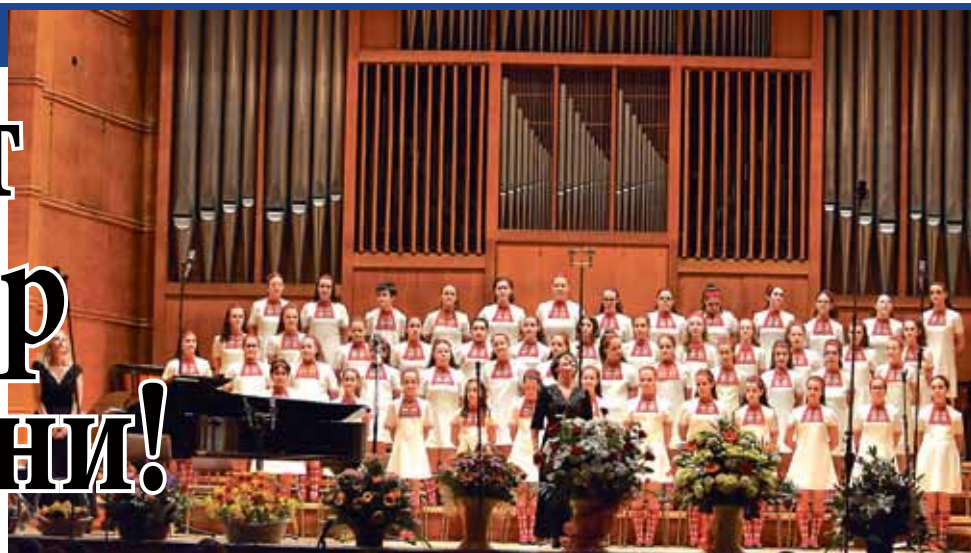
Концертът в зала № 1 на НДК, посветен на годишнината.