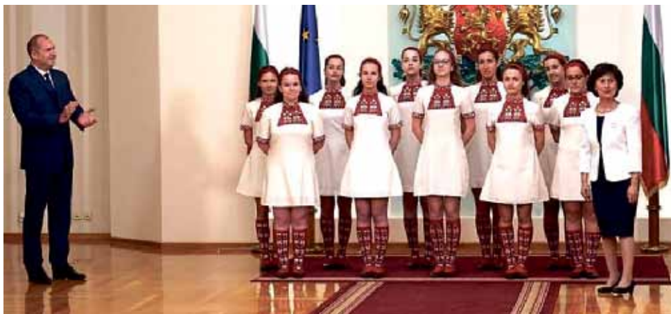
Плакет за принос към българските изкуства и култура получи детският радиохор към Българското национално радио от президента Румен Радев. Вниманието на президентската институция е по повод 60-годишнината на хора.

Източници: bntnews.bg , https://archives.bnr.bg